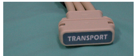
Transportverschluss – so bleibt die Patientenauflage beim Transport gefüllt

AirMed PLUS GmbH info@airmedplus.de www.airmedplus.de