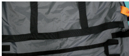
Matratzenbefestigung über elastische Bänder